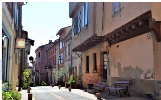
Les ruelles de Verfeil