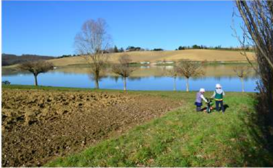
Tour du lac du Laragou à vélo