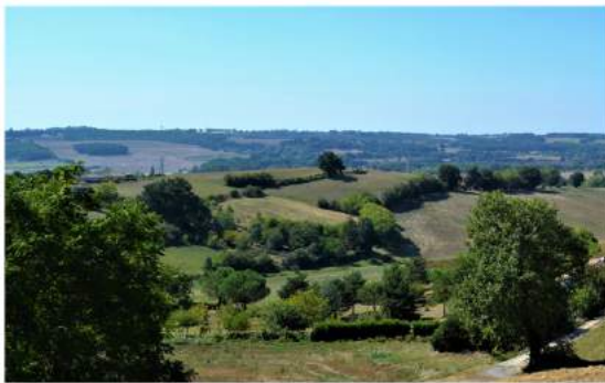
Point de vue sur la campagne Verfeilloise