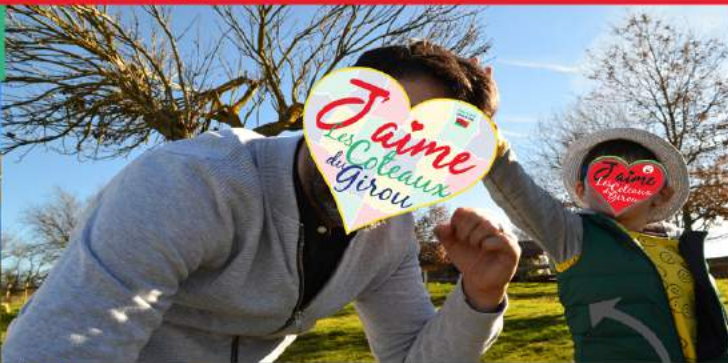
Thème : Zoom sur...

Un moment de complicité familiale capturé, au premier plan.