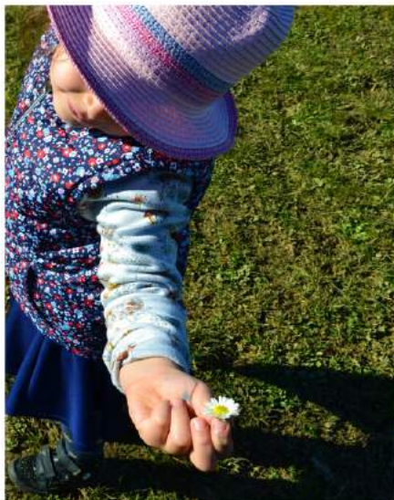
Pause cueillette de pâquerettes