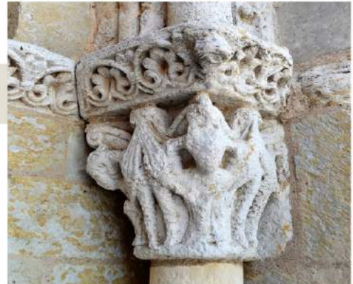
Chapiteau du porche de l'église de Gémil