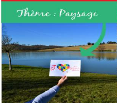
Thème : Paysage