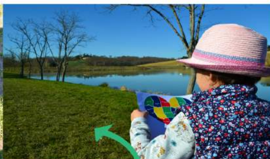
Thème : Paysage