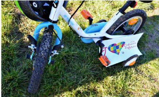
Balade à vélo en Coteaux du Girou

Gros plan sur des individus (merci de veiller à rendre les visages non apparents).