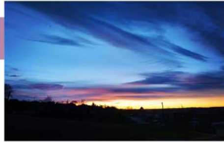
Coucher de soleil en Coteaux du Girou