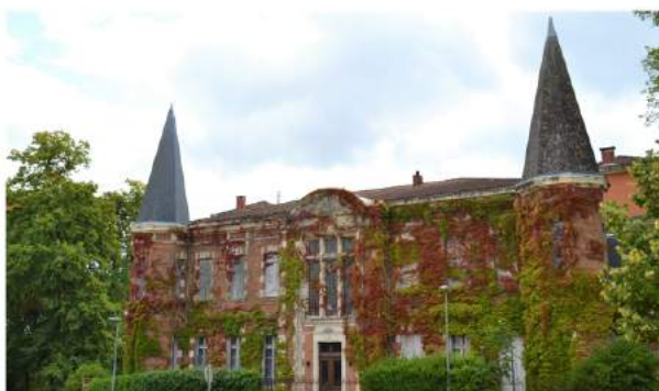
Château de Montastruc-la-Conseillère