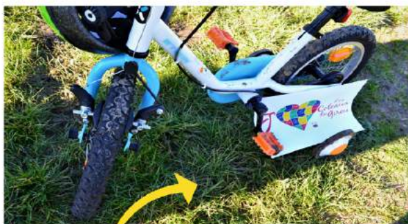
Thème : Zoom sur...

Tu peux utiliser les visuels du concours pour les intégrer à tes photos ou dessiner le tien à l'aide du "cœur coloriage" !