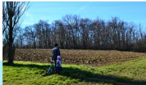
Promenade à la campagne en famille