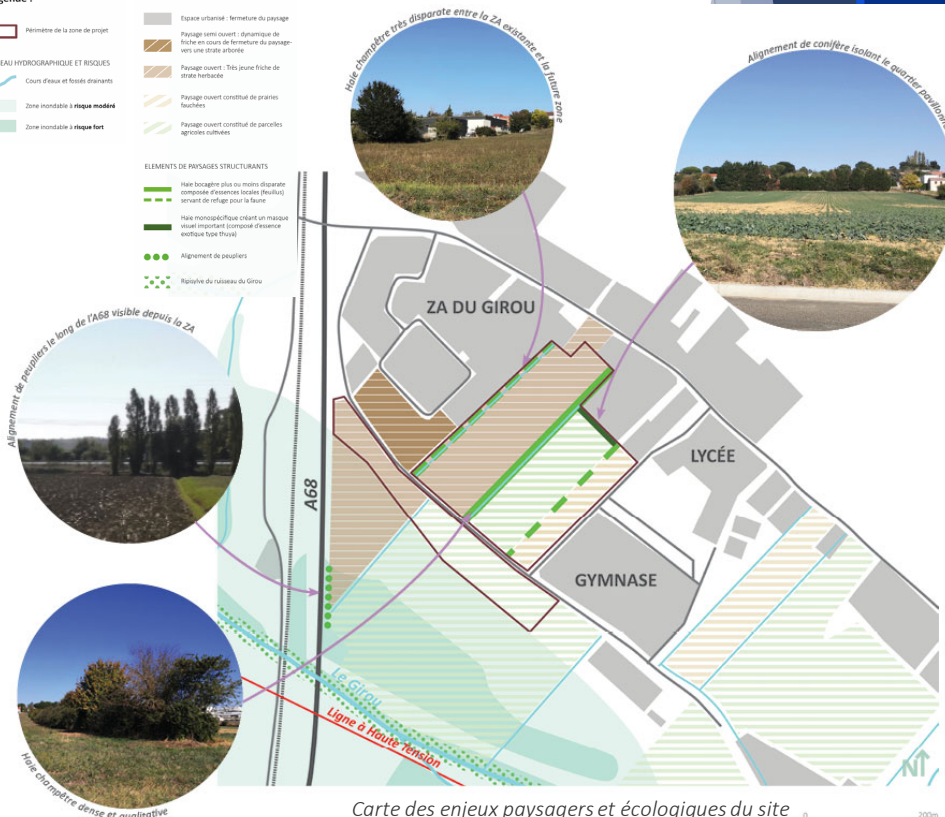
Carte des enjeux paysagers et écologiques du site