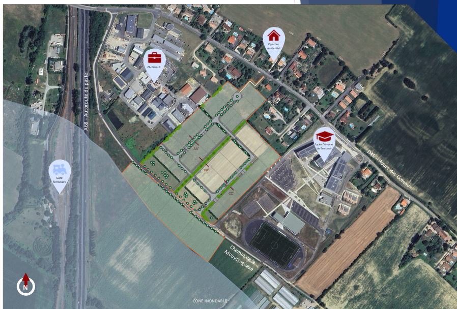
Plan de masse projeté de la ZA du Girou 2 (découpage des lots donné à titre indicatif)